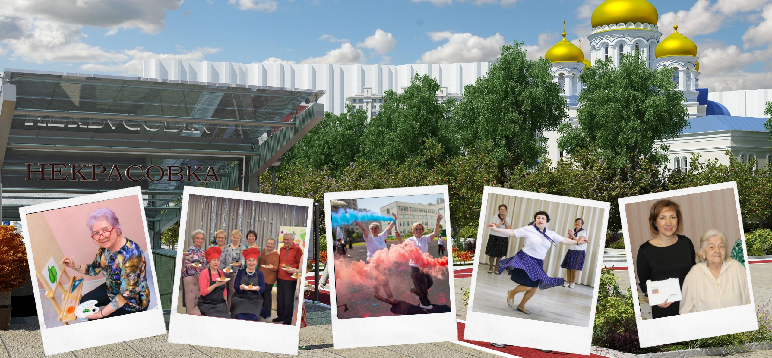
О результатах деятельности ФИЛИАЛА «НЕКРАСОВКА» ГБУ ТЦСО «Жулебино» в 2022 году