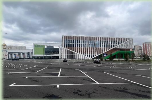
Спортивный комплекс с крытым катком, бассейном, экстрим-парком и зоной воркаут на территории ТПУ «Некрасовка»