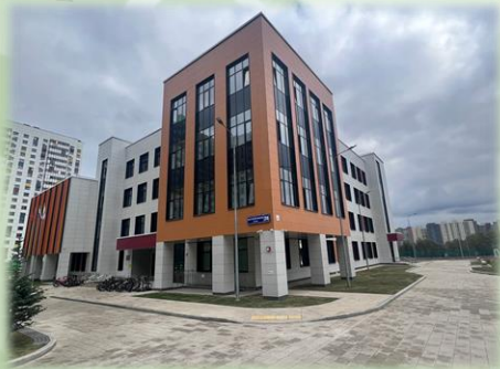
Школа на 550 мест в 14 квартале Люберецких полей