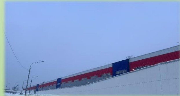
Имущественный комплекс № 7 АО ОЭЗ «Технополис Москва» по адресу: ул. Маресьева, вл. 9