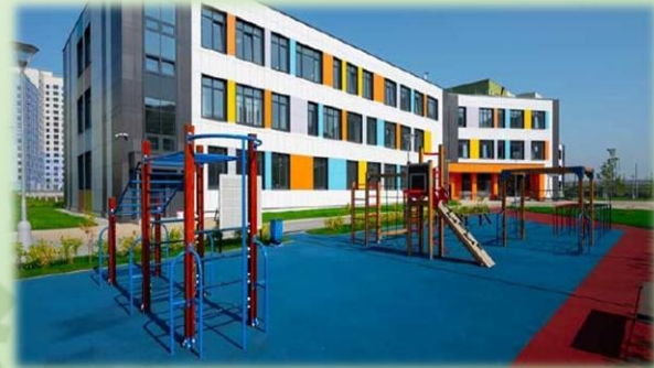
Школа на 1150 мест в 17 квартале Люберецких полей